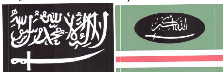
Рисунок 14. Символика вилайетов (административно-территориальных образований) организации «Кавказский эмират» («Имарат Кавказ»).

Отсутствие осознания общественной опасности террористических проявлений подростком может выражаться в наличии в публикациях на его странице или странице его друзей, а также страницах сообществ (групп), в которых он состоит (на которые подписан), информационных материалов, оправдывающих совершение преступлений экстремистской и террористической направленности, в том числе на территории зданий органов государственной власти и местного самоуправления.