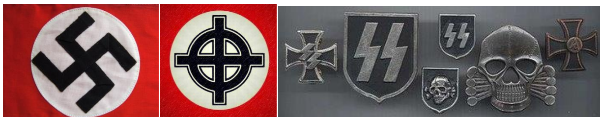
Рисунок 10. Нацистская атрибутика и символика.

Атрибутики, символики запрещенных в Российской Федерации экстремистских и террористических организаций: