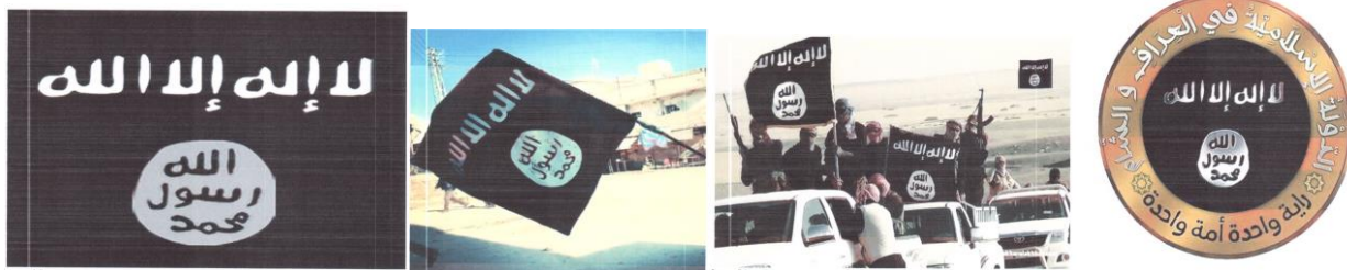
Рисунок 12. Символика организации «Исламское государство».