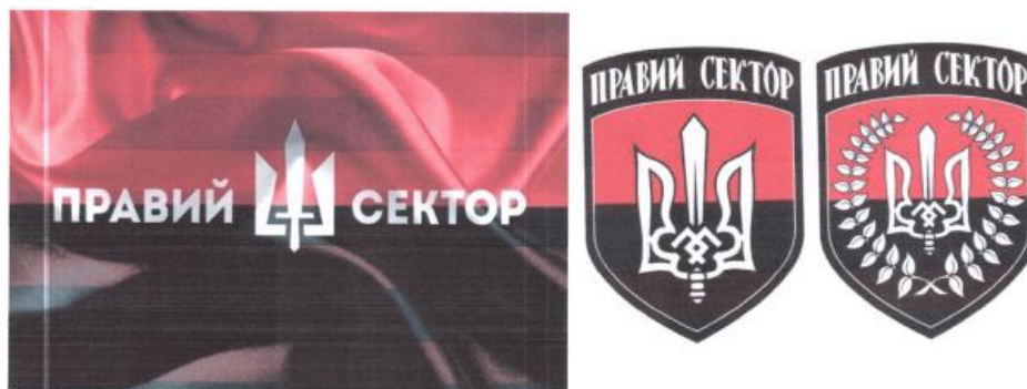
Рисунок 11. Атрибутика организации «Правый сектор».